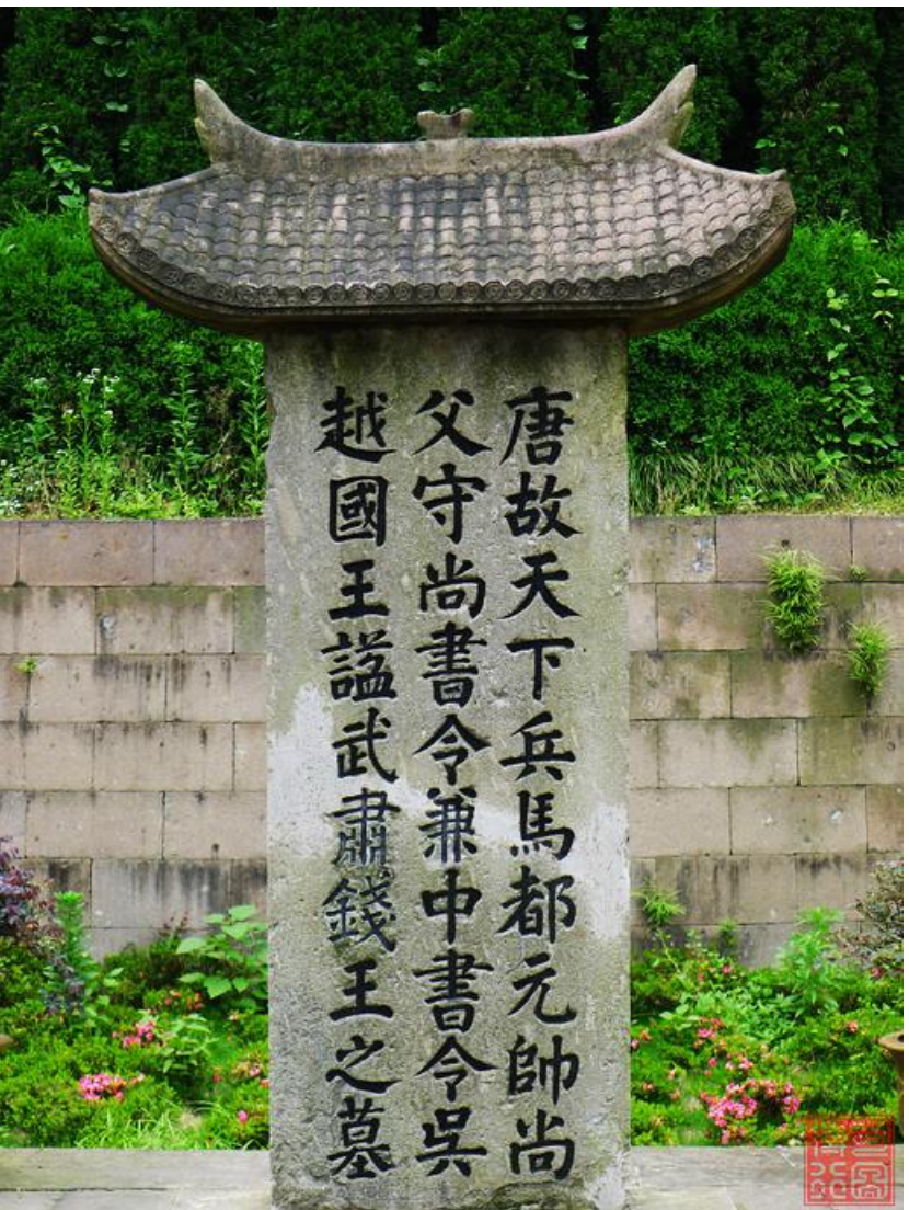
（圖六：杭州臨安吳越國王陵的錢鏐墓。錢鏐是五代十國時期吳越國的創立者。）

中國無錫鴻山錢氏家族自古至今人才輩出：先祖吳越王錢鏐、清代著名的音韻、訓詁學家錢大昕、近代清華才子錢鐘書、被譽為「中國最後一位士大夫」的國學家錢穆……為數眾多的學界泰斗燦若繁星，代代不絕，其中的奧秘是在哪裡呢？這無不歸功於錢氏優良的家庭教育。