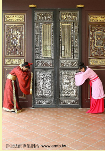
淨空法師專集網站 www.amb.tw